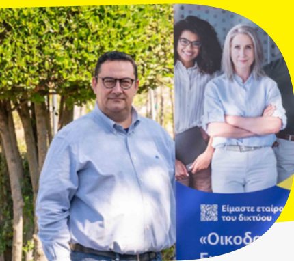
Dimitrios Koukouvinos Presidente del Pleno de Ílion

Ha habido más de 1 200 actividades de comunicación realizadas por más de 500 miembros de la red BELC que tomaron la iniciativa. A continuación puede ver una pequeña selección de historias. Para más información, visite el sitio web de buenas prácticas.