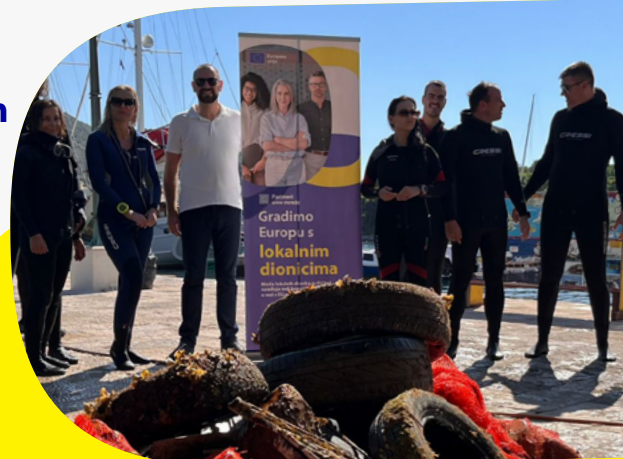
Limpieza submarina en Dubrovnik organizada por el municipio como parte de las campañas de limpieza de playas de la UE

El 21 de septiembre, el alcalde Mato Franković celebró el Día Mundial de la Limpieza con una recogida de basuras submarina en Zaton, como parte de la iniciativa de limpieza de playas de la UE . Se recogió más de media tonelada de residuos del fondo marino. El acto, que estuvo respaldado con una carta de intenciones firmada por él, puso de relieve los esfuerzos de Dubrovnik por mantener un medio marino más limpio y demostró la participación efectiva de la comunidad en la protección del medio ambiente.