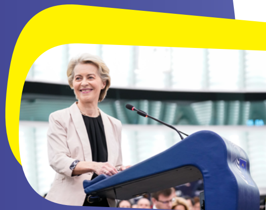
Ursula von der Leyen Presidenta de la Comisión Europea

A partir de 2025, estará plenamente operativa la nueva red conjunta de corresponsales locales de la UE . Los miembros de la red recibirán una serie de productos renovados con una nueva identidad visual, incluido un nuevo boletín, al tiempo que mantendrán su acceso privilegiado a productos y servicios clave de la UE, sitios web, etc.