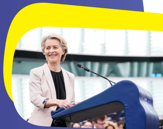
Ursula von der Leyen présidente de la Commission européenne

À partir de 2025, le nouveau réseau commun de conseillers locaux de l'UE sera pleinement opérationnel. Les membres recevront une série de produits remaniés, sous une nouvelle identité visuelle, y compris un nouveau bulletin d'information, tout en conservant leur accès privilégié aux produits et services essentiels de l'UE, au site web, etc.