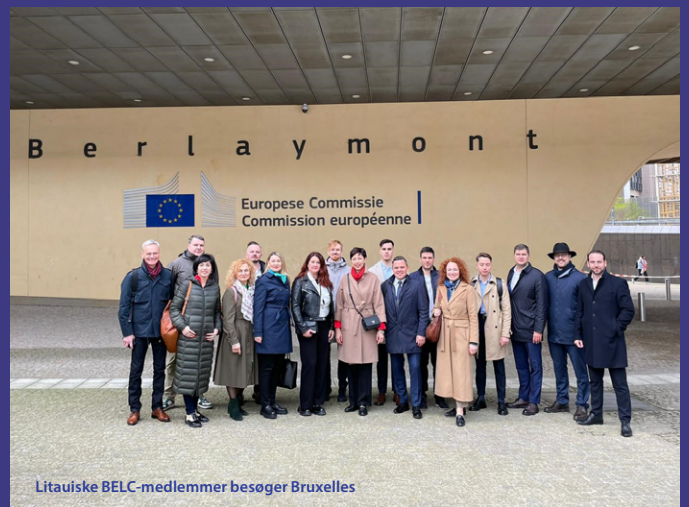
Litauiske BELC-medlemmer besøger Bruxelles