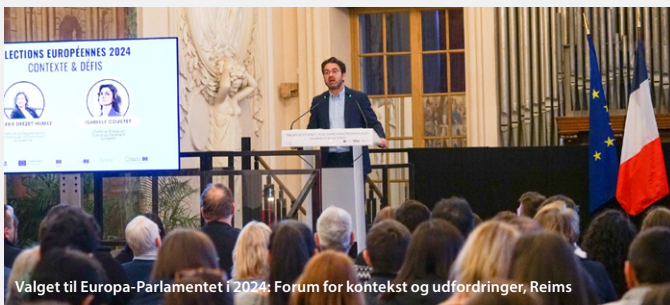
Valget til Europa-Parlamentet i 2024: Forum for kontekst og udfordringer, Reims