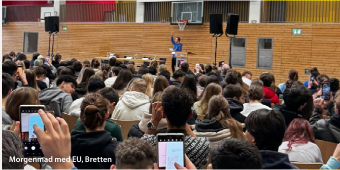
Morgenmad med EU, Bretten

BELC-medlemmerne var meget aktive med hensyn til at inddrage borgerne forud for valget til Europa-Parlamentet. Her er et udsnit.