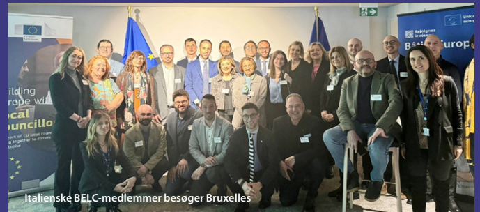
Italienske BELC-medlemmer besøger Bruxelles