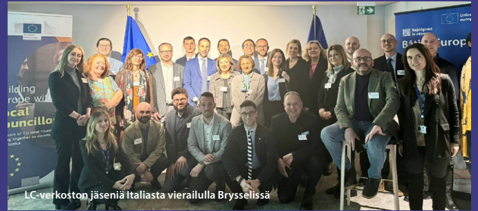
LC-verkoston jäseniä Italiasta vierailulla Brysselissä

Kreikan ja Kyproksen yhteisellä valtuuskunnalla oli tilaisuus käydä pitkä keskustelu komission jäsenen Margaritis Schinasin kanssa. Hän kiitti BELC-aloitetta ja kirjoitti X-palvelussa: "Kiitos Paikallispäätäjät EU:ta