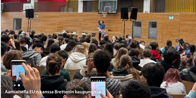
Aamiaisella EU:n kanssa Brettenin kaupungissa

Verkoston jäsenet pyrkivät EU-vaalien alla aktiivisesti kannustamaan kansalaisia mukaan. Tässä muutamia toimintoja.