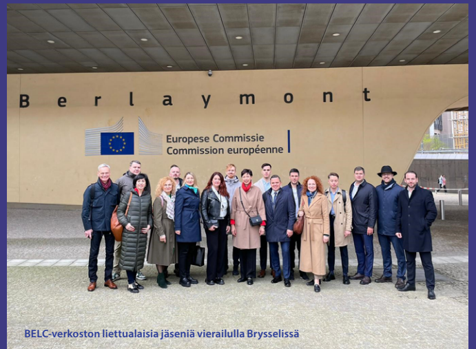
BELC-verkoston liettualaisia jäseniä vierailulla Brysselissä