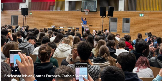
Bricfeasta leis an Aontas Eorpach, Cathair Bretten

Bhí baill BELC an-ghníomhach maidir le dul i dteagmháil le saoránaigh le linn na tréimhse roimh na toghcháin Eorpacha. Níl anseo ach spléachadh.