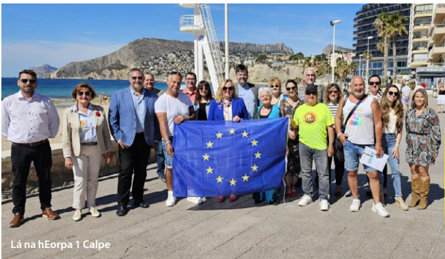
Lá na hEorpa 1 Calpe

Mhárta aghaidh ar shaincheisteanna tábhachtacha meabhairshláinte agus folláine. Bhí níos mó ná 300 duine i láthair ag an imeacht, gairmithe, oideachasóirí agus ceannairí áitiúla ina measc, agus mar thoradh air sin tugadh tiomantas dul isteach sa Chomhghuaillíocht Eorpach in aghaidh an Dúlagrair.