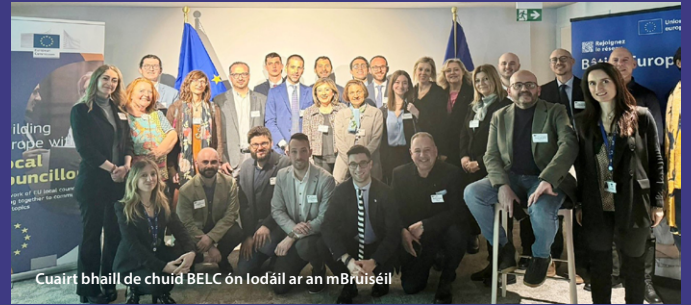
Cuairt bhaill de chuid BELC ón Iodáil ar an mBruiséil

Bhí deis ag toscaireacht chomhphárteach na Gréige agus na Cipire díospóireacht fhada a bheith acu leis an gCoimisinéir Margaritis Schinas, a mhol tionscnamh BELC. Chuir sé an phostáil seo a leanas ar X: ‘Gabhaim buíochas leis an Líonra ‘Ag