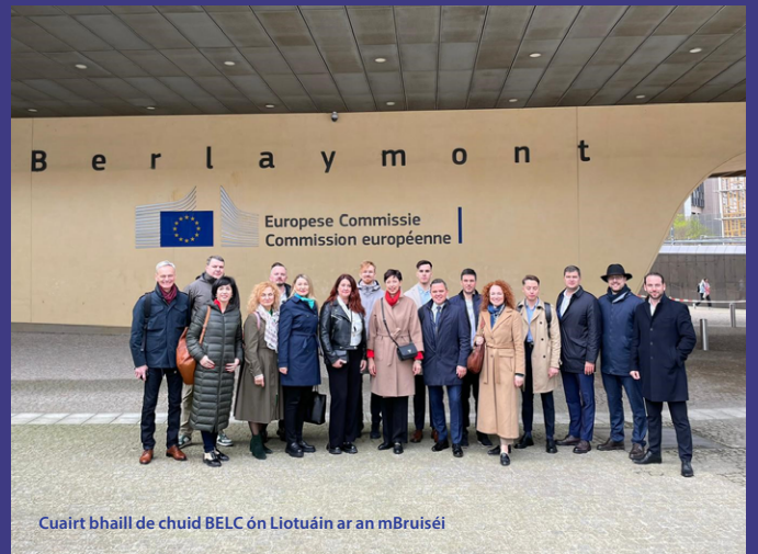
Cuairt bhaill de chuid BELC ón Liotuáin ar an mBruiséil