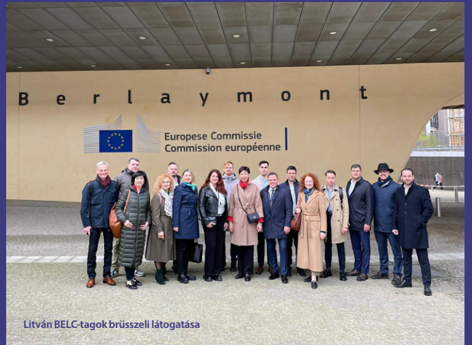
Litván BELC-tagok brüsszeli látogatása

a következőt osztotta meg: „Köszönet az „Európa építése helyi képviselőkkel” hálózatnak az uniós szakpolitikák megértésének és az azokkal kapcsolatos tájékoztatásnak a jobbá tételéről folytatott időszerű megbeszélésért.”