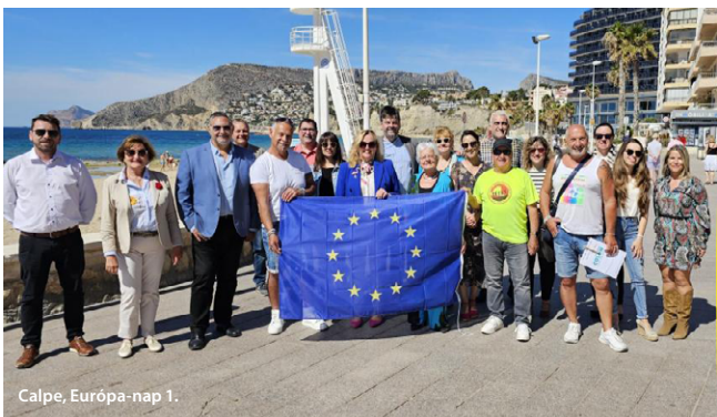
Calpe, Európa-nap 1.

című márciusi konferencia, amelyen több mint 300-an – többek között szakemberek, oktatók és helyi vezetők – vettek részt, a mentális egészséggel és jólléttel kapcsolatos fontos kérdésekkel foglalkozott; a konferencia csúcspontjaként a jelenlévők kötelezettséget vállaltak arra, hogy csatlakoznak az Európai Szövetség a Depresszió Ellen szervezetéhez.