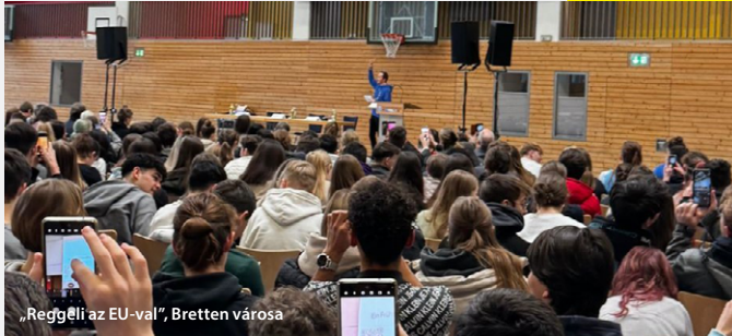
„Reggeli az EU-val”, Bretten városa

A BELC-tagok nagyon aktívan működtek közre abban, hogy szerepvállalásra ösztönözzék a polgárokat az európai választások előtti időszakban. Íme egy pillanatkép az eseményekről: