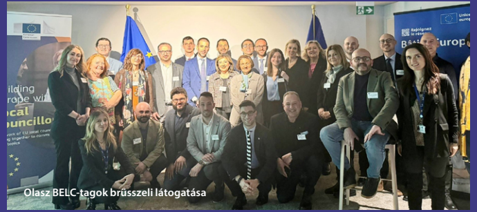
Olasz BELC-tagok brüsszeli látogatása