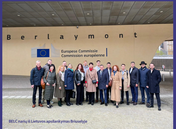
BELC narių iš Lietuvos apsilankymas Briuselyje