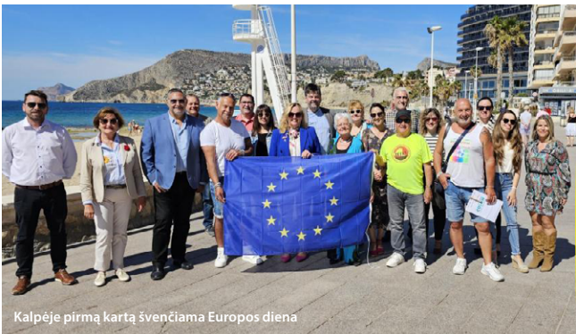
Kalpėje pirmą kartą švenčiama Europos diena

prieš depresiją “, skirtoje aptarti svarbius psichikos sveikatos ir gerovės klausimus, dalyvavo daugiau nei 300 dalyvių, įskaitant specialistus, pedagogus ir vietos lyderius. Konferencijos pabaigoje įsipareigota prisijungti prie Europos kovos su depresija aljanso.