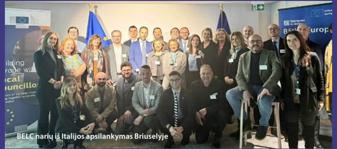
BELC narių iš Italijos apsilankymas Briuselyje

Graikijos ir Kipro bendra delegacija turėjo galimybę surengti išsamią diskusiją su Komisijos nariu Margaričiu Schinu, kuris pagyrė BELC iniciatyvą. „X“ tinkle jis rašė: „Dėkoju tinklui „Kuriam Europą su vietos savivalda“ už laiku surengtas diskusijas, kaip gerinti supratimą apie ES politiką ir komunikaciją apie ją.“