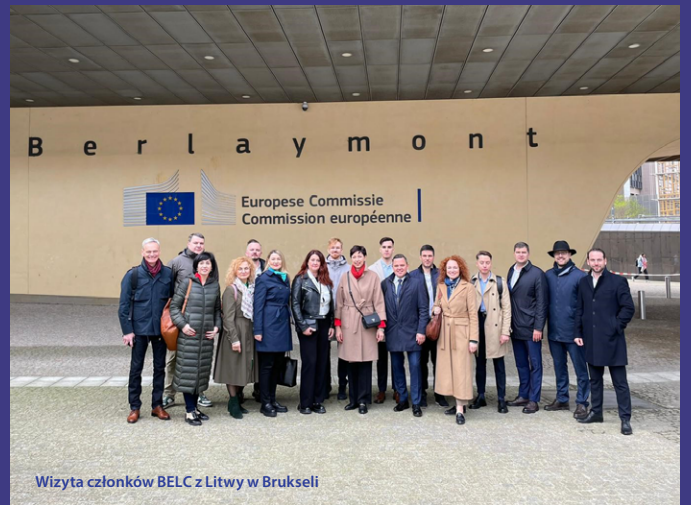
Wizyta członków BELC z Litwy w Brukseli

„Podziękowania dla sieci »Tworzenie Europy razem z samorządami lokalnymi« za tę także potrzebną teraz dyskusję na temat informowania i szerzenia wiedzy o unijnej polityce!”