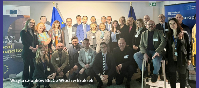
Wizyta członków BELC z Włoch w Brukseli