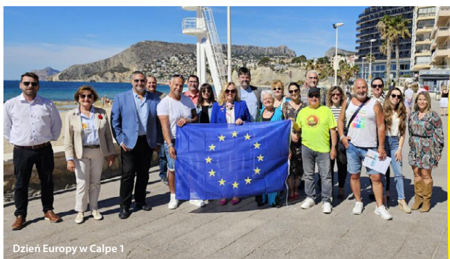
Dzień Europy w Calpe 1

KE w Polsce, punktem EUROPE DIRECT w Mińsku Mazowieckim i gminą mińską . Wzięło w niej udział ponad 300 uczestników, w tym specjaliści, pedagodzy i przywódcy lokalni, a jej punktem kulminacyjnym było złożenie zobowiązania do przyłączenia się do Europejskiego Sojuszu przeciwko Depresji.