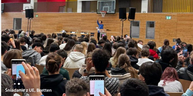
Sniadanie z UE, Bretten

Członkowie BELC bardzo aktywnie angażowali obywateli w przygotowania do wyborów europejskich. Oto krótka relacja.