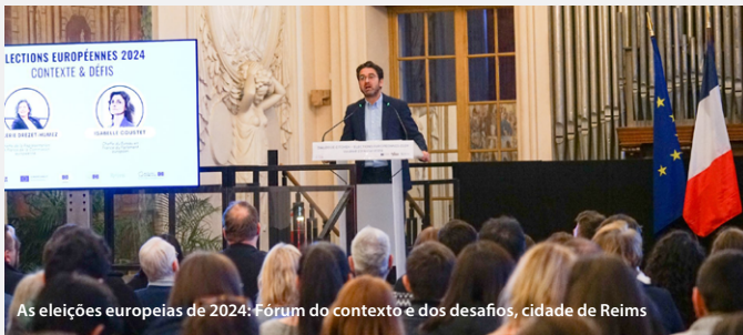
As eleições europeias de 2024: Fórum do contexto e dos desafios, cidade de Reims