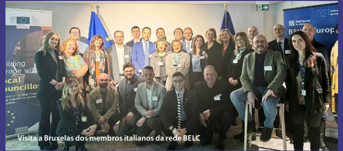
Visita a Bruxelas dos membros italianos da rede BELC