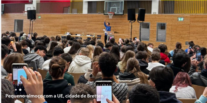
Pequeno-almoço com a UE, cidade de Bretten

Os membros da rede BELC empenharam-se ativamente na sensibilização dos cidadãos para a preparação das eleições europeias. Eis apenas uma breve síntese.