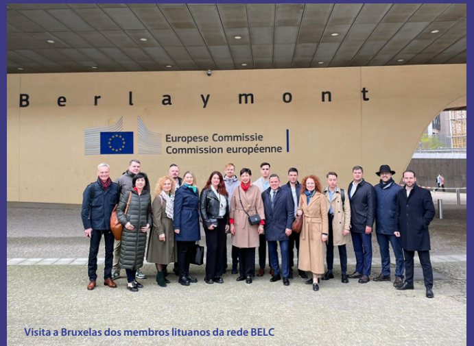
Visita a Bruxelas dos membros lituanos da rede BELC

no X: «Agradecemos à rede Construir a Europa com os Conselheiros Locais pelo debate oportuno sobre a melhoria da compreensão sobre as políticas da UE e da comunicação correlata.»