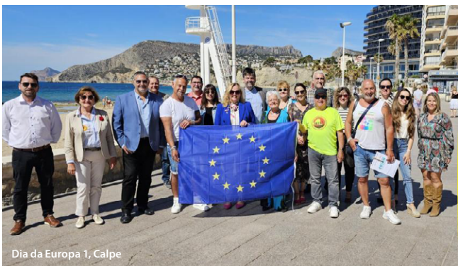
Dia da Europa 1, Calpe

Juntos contra a Depressão abordou importantes questões relacionadas com a saúde mental e o bem-estar, contando com mais de 300 participantes, entre os quais profissionais, educadores e dirigentes locais, tendo culminado num compromisso de adesão à Aliança Europeia contra a Depressão.