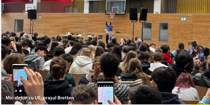
Mic-dejun cu UE, orașul Bretten

Membrii BELC au contribuit foarte activ la implicarea cetățenilor în perioada premergătoare alegerilor europene. Mai jos este doar o trecere în revistă a activităților organizate.