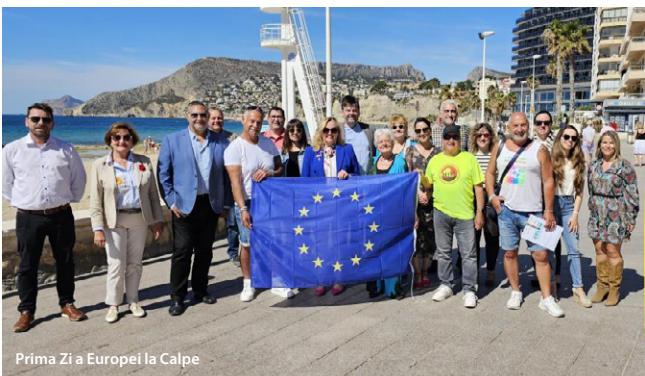
Prima Zi a Europei la Calpe

conferința Împreună împotriva depresiei din martie a tratat aspecte importante legate de sănătatea mintală și bunăstare, a avut peste 300 de participanți, inclusiv profesioniști, lectori și lideri locali, având ca rezultat un angajament de aderare la Alianța europeană împotriva depresiei.