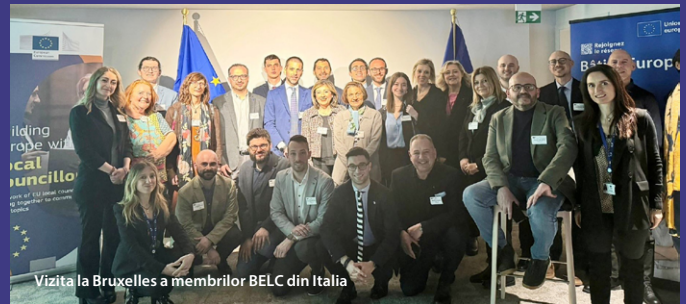
Vizita la Bruxelles a membrilor BELC din Italia

Delegația comună a Greciei și a Ciprului a avut ocazia de a purta o dezbateră îndelungată cu comisarul Margaritis Schinas, care a lădat inițiativa BELC. Acesta a postat pe X: „Mulțumesc rețelei «Construim Europa împreună cu