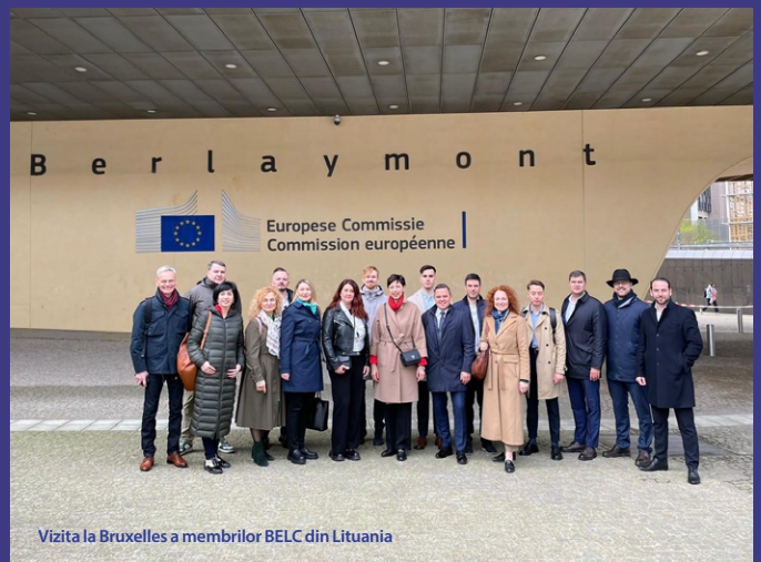
Vizita la Bruxelles a membrilor BELC din Lituania

autoritățile locale» pentru o discuție oportună despre cum să înțelegem mai bine politicile UE și să comunicăm mai eficient în privința acestora.”