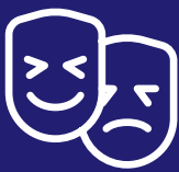
Kultūras mantojuma un tradīciju novērtēšana