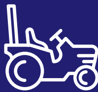
Ekonomiskās iespējas lauku teritorijās, tostarp jauniem lauksaimniekiem