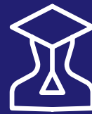
Aċċess għal edukazzjoni (ta' kwalità), inklużi l-edukazzjoni għas-sostenibbiltà ambjentali u d-digitalizzazzjoni