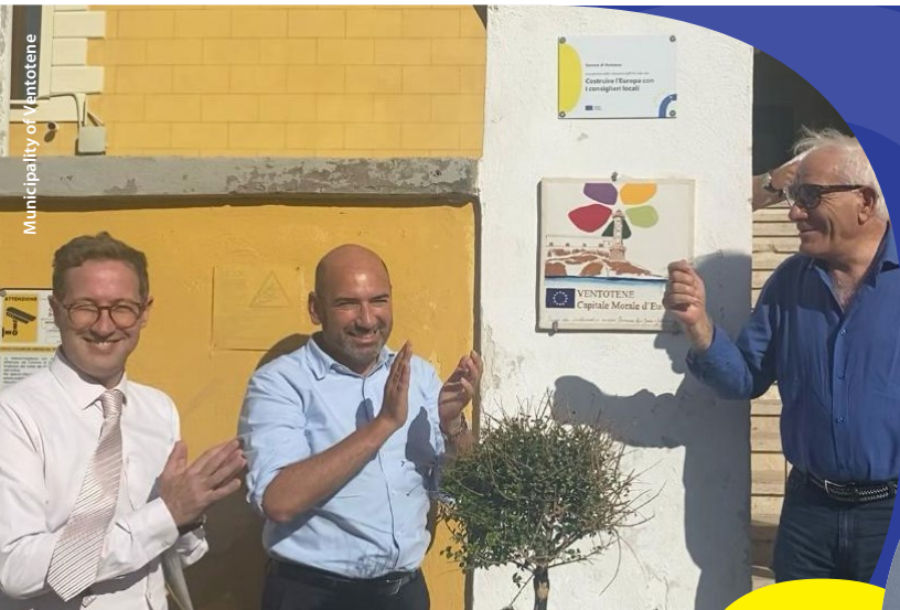
Municipality of Ventotene