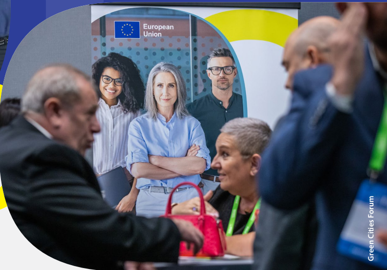
Green Cities Forum

Det var en viktig milstolpe för BELC: dess första konkreta samarbete med sin motsvarighet och sitt dubbla nätverk, nätverket för fullmäktigeledamöter med ansvar för EU-frågor, som förvaltas av Regionkommittén. Vid en särskild workshop